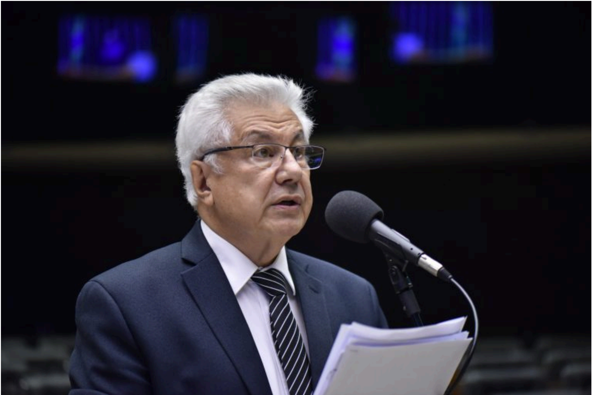
O deputado Arlindo Chinaglia

O deputado Arlindo Chinaglia (PT-SP) foi eleito, nessa segunda-feira (9), presidente do Parlamento do Mercosul (Parlasul). Ele assumirá a presidência a partir de 1º de janeiro de 2025.